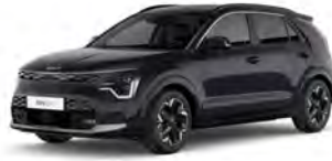
Perleťová Černá Aurora (ABP)