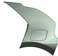
Zelená Cityscape (CGE)