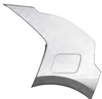
Šedá Interstellar (AGT)