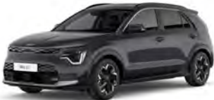
Šedá Interstellar (AGT)