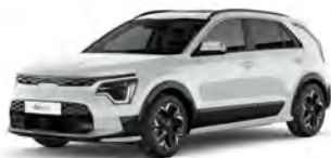
Perleťová Bílá Snow (SWP)