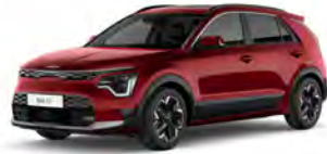
Červená Runway (CR5)