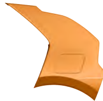
Oranžová Tangerine (TGT)