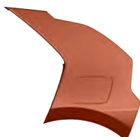
Oranžová Delight (DRG)