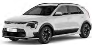
Bílá Clear (UD)