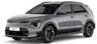
Šedá Steel (KLG)