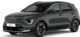
Zelená Cityscape (CGE)