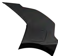
Perleťová Černá Aurora (ABP)