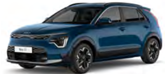
Modrá Mineral (M4B)