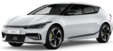
Perleťová Bílá Snow (SWP)