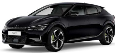
Perleťová Černá Aurora (ABP)