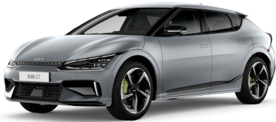
Speciální matná Šedá Mooncape (KLM)