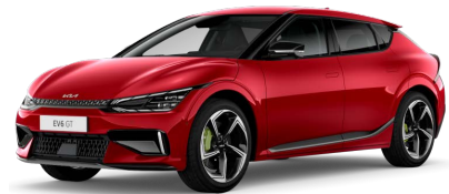
Červená Runway (CR5)