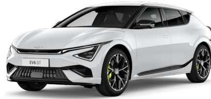
Perleťová bílá Snow (SWP)