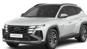
Serenity White Pearl Perleťová Cena: 0 Kč