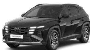
Abyss Black Pearl Perleťová Cena: 0 Kč