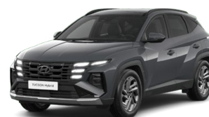
Ecotronic Gray Pearl Perleťová Cena: 0 Kč