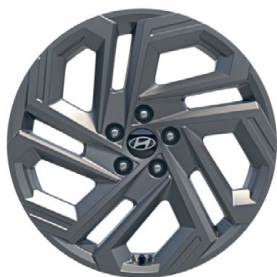
19" kola z lehké slitiny

www.porovnejhyundai.cz (Porovnejte si vozy Hyundai s konkurencí)