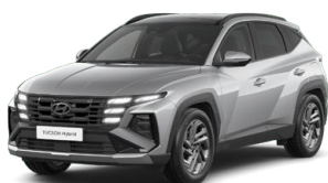
Shimmering Silver Metallic Metalická Cena: 0 Kč