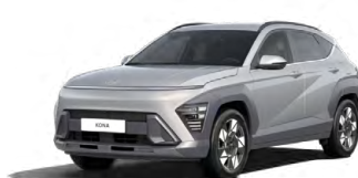
Shimmering Silver Metallic Metalická Kombinace dostupná také s černým lakováním střechy Cena: 17 900 Kč