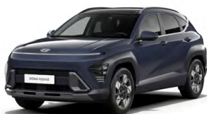
Denim Blue Pearl Perleťová Kombinace dostupná také s černým lakováním střechy Cena: 17 900 Kč