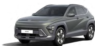
Amazon Gray Metalická Kombinace dostupná také s černým lakováním střechy Cena: 17 900 Kč