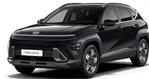
Abyss Black Pearl Perleťová Cena: 17 900 Kč