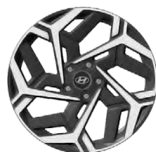
Unikátní N Line 18" kola z lehké slitiny

www.porovnejhyundai.cz (Porovnejte si vozy Hyundai s konkurencí)