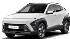
Atlas White Pastelová Kombinace dostupná také s černým lakováním střechy Cena: 9 900 Kč