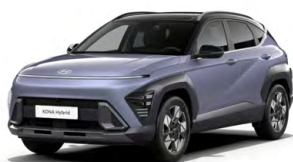
Meta Blue Pearl Perleťová Kombinace dostupná také s černým lakováním střechy Cena: 17 900 Kč