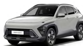
Cyber Gray Metallic Metalická Kombinace dostupná také s černým lakováním střechy Cena: 17 900 Kč