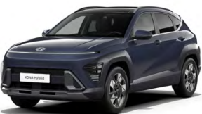
Denim Blue Pearl Perleťová Kombinace dostupná také s černým lakováním střechy Cena: 17 900 Kč