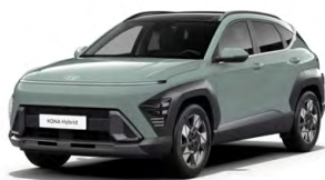
Mirage Green Pastelová Kombinace dostupná také s černým lakováním střechy Cena: 0 Kč