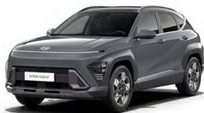
Ecotronic Gray Pearl Perleťová Kombinace dostupná také s černým lakováním střechy Cena: 17 900 Kč