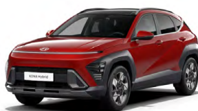
Ultimate Red Metallic Metalická Kombinace dostupná také s černým lakováním střechy Cena: 17 900 Kč