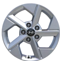
16" kola z lehké slitiny