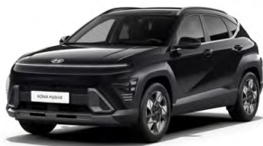
Abyss Black Pearl Perleťová Cena: 17 900 Kč