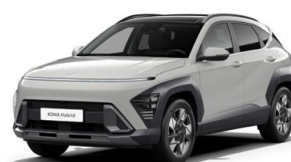
Cyber Gray Metallic Metalická Kombinace dostupná také s černým lakováním střechy Cena: 17 900 Kč