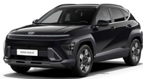
Abyss Black Pearl Perleťová Cena: 17 900 Kč