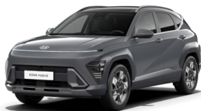
Ecotronic Gray Pearl Perleťová Kombinace dostupná také s černým lakováním střechy Cena: 17 900 Kč