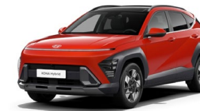
Soultronic Orange Pearl Perleťová Kombinace dostupná také s černým lakováním střechy Cena: 17 900 Kč