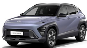
Meta Blue Pearl Perleťová Kombinace dostupná také s černým lakováním střechy Cena: 17 900 Kč