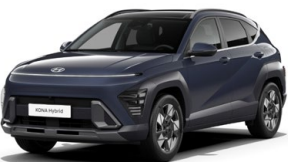
Denim Blue Pearl Perleťová Kombinace dostupná také s černým lakováním střechy Cena: 17 900 Kč