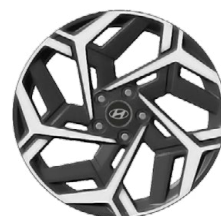
Unikátní N Line 18" kola z lehké slitiny

www.porovnejhyundai.cz (Porovnejte si vozy Hyundai s konkurencí)