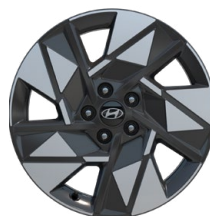
18" kola z lehké slitiny