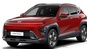
Ultimate Red Metallic Metalická Kombinace dostupná také s černým lakováním střechy Cena: 17 900 Kč