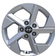
16" kola z lehké slitiny