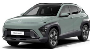
Mirage Green Pastelová Kombinace dostupná také s černým lakováním střechy Cena: 0 Kč