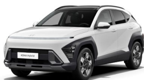
Atlas White Pastelová Kombinace dostupná také s černým lakováním střechy Cena: 9 900 Kč