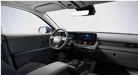
Černý interiér – látkové čalounění sedadel – dostupné pro Smart, Style