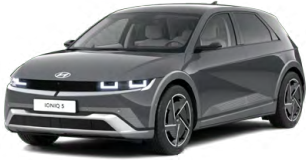
Ecotronic Gray Perleťová Cena: 19 900 Kč