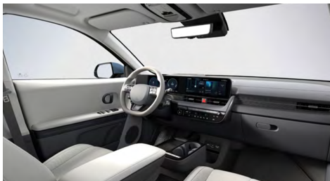
Šedý interiér – kožené čalounění sedadel – výhradně pro Style Premium