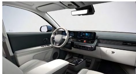
Šedo zelený interiér – kožené čalounění sedadel – výhradně pro Style Premium