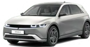
Gravity Gold Matná metalická Cena: 24 900 Kč