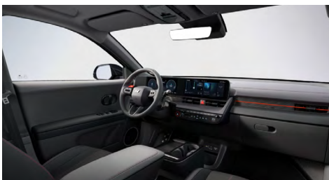
N Line interiér – čalounění sedadel kůže-látka – výhradně pro N Line Style