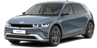
Lucid Blue Perleťová Cena: 19 900 Kč Nelze pro N Line