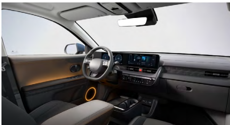
Černý interiér – čalounění sedadel kůže-látka – dostupné pro Style na přání