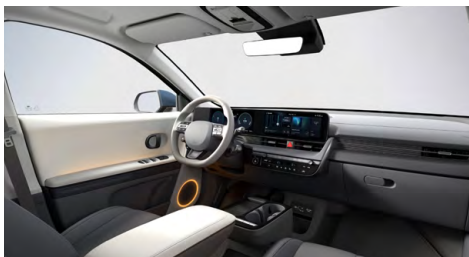
Šedý interiér – čalounění sedadel kůže-látka – dostupné pro Style na přání