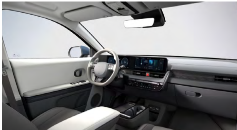
Šedý interiér – látkové čalounění sedadel – dostupné pro Smart, Style