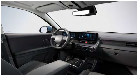
Černý interiér – kožené čalounění sedadel – výhradně pro Style Premium