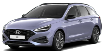
Meta Blue Pearl Perleťová Cena: 16 900 Kč