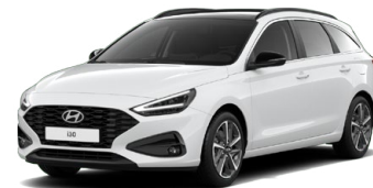
Serenity White Pearl Perleťová Cena: 16 900 Kč