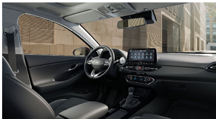
Černý interiér Oceanidis Black Premium – kožené čalounění sedadel – světlé čalounění stropu a obložení bočních sloupků – černé provedení přístrojové desky a výplně dveří