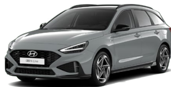
Shadow Gray Pastelová Cena: 16 900 Kč Dostupná pouze pro výbavy N Line