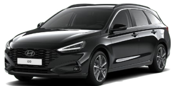
Abyss Black Pearl Perleťová Cena: 16 900 Kč