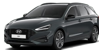
Cypress Green Pearl Perleťová Cena: 16 900 Kč