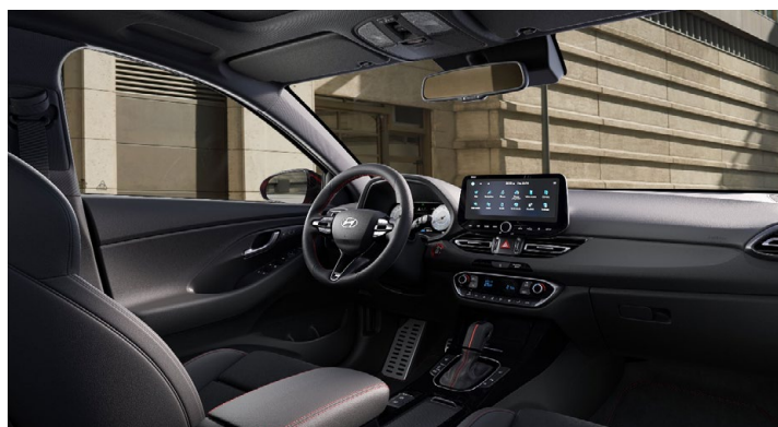
Černý interiér N line Premium – prémiové čalounění v kombinaci kůže/semiš – červeně prošívání sportovní volant, hlavice řadící páky a loketní opěrka