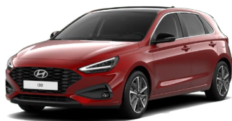
Ultimate Red Metallic Metalická Cena: 16 900 Kč