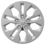
15" ocelová kola s celoplošnými kryty