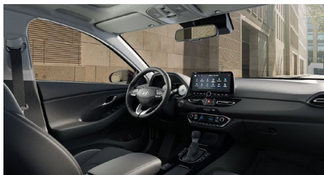
Černý interiér Oceanidis Black – látkové čalounění sedadel – světlé čalounění stropu a obložení bočních sloupků – černé provedení přístrojové desky a výplní dveří