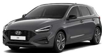
Ecotronic Gray Pearl Perleťová Cena: 16 900 Kč