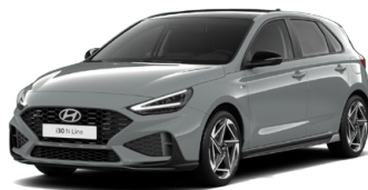
Shadow Gray Pastelová Cena: 16 900 Kč Dostupná pouze pro výbavy N Line