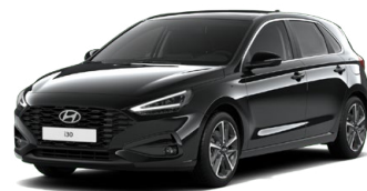
Abyss Black Pearl Perleťová Cena: 16 900 Kč