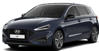
Sailing Blue Pearl Perleťová Cena: 16 900 Kč