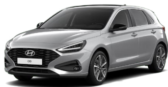
Shimmering Silver Metallic Metalická Cena: 16 900 Kč