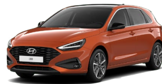
Jupiter Orange Metallic Metalická Cena: 16 900 Kč