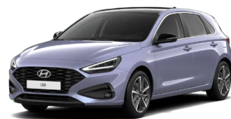
Meta Blue Pearl Perleťová Cena: 16 900 Kč