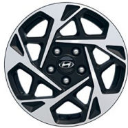
16" kola z lehké slitiny