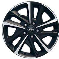
17" kola z lehké slitiny