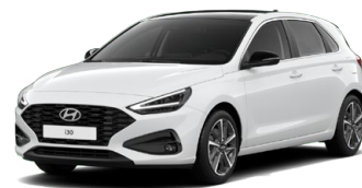
Serenity White Pearl Perleťová Cena: 16 900 Kč