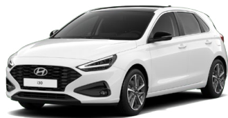
Atlas White Pastelová Cena: 5 900 Kč