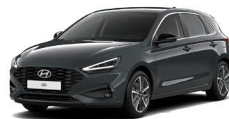
Cypress Green Pearl Perleťová Cena: 16 900 Kč