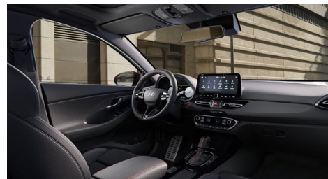
Černý interiér N line – látkové čalounění s červeným prošíváním a logem N – černé čalounění stropu a obložení bočních sloupků – červeně prošívání sportovní volant, hlavice řadící páky a loketní opěrka