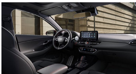
Černý interiér N line Premium – prémiové čalounění v kombinaci kůže/semiš – červeně prošívání sportovní volant, hlavice řadící páky a loketní opěrka